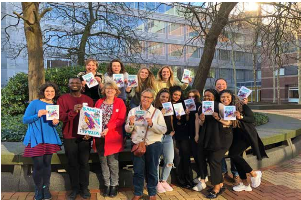
Onze enthousiaste (student) buddy's klaar om ingezet te worden!

In 2019 is Buddy Netwerk, samen met de Haagse Hogeschool en OpenJeHart een nieuw buddyproject gestart: "Samen Vitaal". In dit project begeleidt een student buddy een kwetsbare oudere voor een half jaar naar meer vitaliteit en verbinding met zijn of haar leefomgeving. Na drie maanden sluit de senior zich aan bij de wandelgroep "OpenJeHart". Het is een innovatief project vanwege de samenwerking met een Hogeschool en het bedrijfsleven, waarbij wij onze kracht en expertise bundelen bij de aanpak van een maatschappelijk probleem. In 2020 worden 20 Samen-Vitaal buddy's getraind en ingezet die aan tenminste 20 ouderen gekoppeld worden.