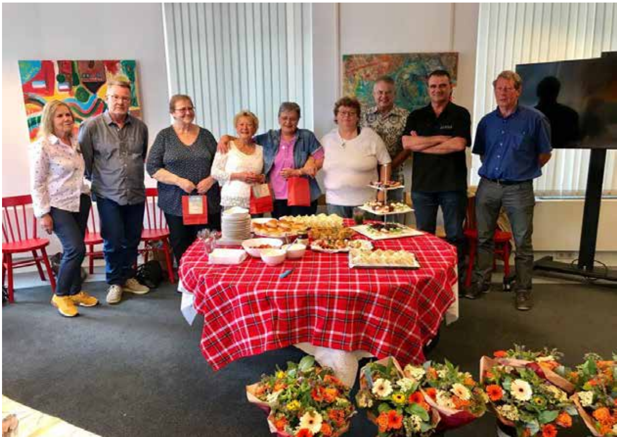
Uitreiking buddy-beeldje aan vrijwilligers, die 5 jaar vrijwilliger zijn bij Stichting Buddy Netwerk

Onze financiers en wijzelf willen continu weten wat de effectiviteit is van de aangeboden dienstverlening. Wat we erin stoppen qua middelen is makkelijk zichtbaar te maken, evenals de direct zichtbare resultaten. Wij proberen zoveel mogelijk het effect te meten of de buddy-inzet heeft bijgedragen aan de beoogde doelen. Wat heeft de buddy bijgedragen aan het versterken en ondersteunen van een cliënt? Hoe was de situatie in het begin? En na het traject waarin de cliënt een buddy had? Hiervoor blijven wij ons eigen meetinstrument 'De Buddy Netwerk Versterkingsmeter' verder ontwikkelen en verbeteren. Naast meten is het vertellen van 'verhalen' belangrijk. Wat is de impact van de inzet van een buddy?